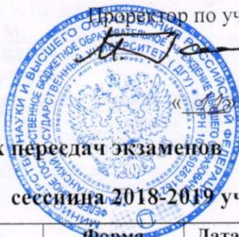
График комиссионных пересдач экзаменов

зимней зачетно - экзаменационной сессии 2018-2019 учебного год