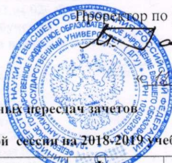
График комиссионных пересдач зачетов

зимней зачетно - экзаменационной сессии на 2018-2019 учебный год