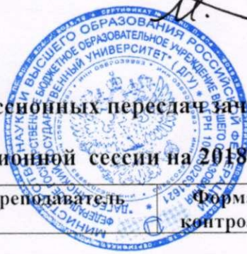
График комиссионных передач зачетов

зимней зачетно - экзаменационной сессии на 2018-2019 учебный год